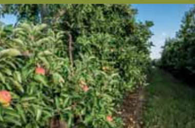
Les Vergers de la Manse

Discover a wealth of hidden gems on the border of the Touraine in the Sainte-Maure area. A boldly coloured church, troglodyte dwellings and a castle emerge down country lanes surrounded by woodland in the heart of a pleasant valley... This promenade has some great surprises in store for you, enabling you to appreciate the rolling landscape, ideal for relaxation.