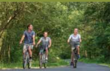
Dans les bois

Take advantage of the scenic routes around Les Coteaux and Sainte Maure de Touraine. Discover other cycling loops and further information on interesting places to visit on our web site : www.loches-valde Loire.com .