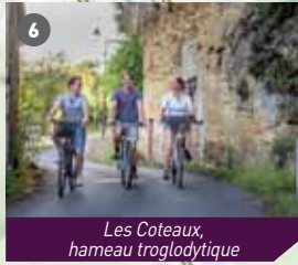
Les Coteaux, hameau troglodytique