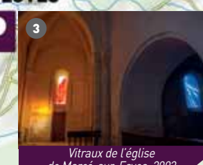
Vitraux de l'église de Marcé-sur-Esves, 2003