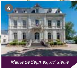
Mairie de Sepmes, XIX e siècle