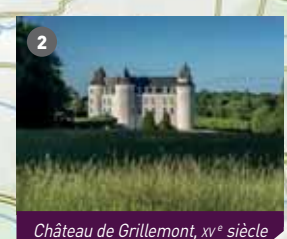
Château de Grillemont, XV e siècle