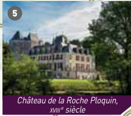
Château de la Roche Ploquin, XVIII e siècle